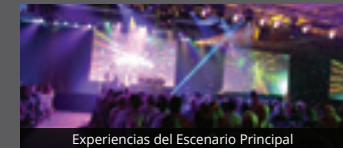
Experiencias del Escenario Principal