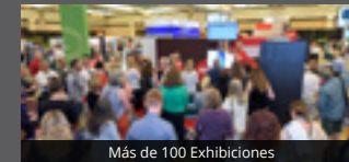
Más de 100 Exhibiciones